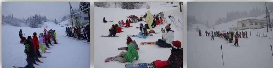
スキー指導保護者ボランティアの皆様対象、指導法講習会の様子